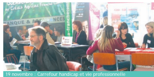
19 novembre : Carrefour handicap et vie professionnelle