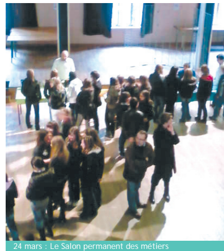
24 mars : Le Salon permanent des métiers