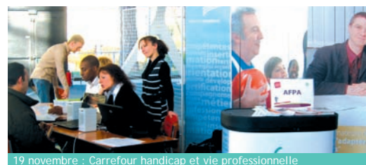
19 novembre : Carrefour handicap et vie professionnelle