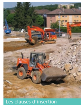
Les clauses d'insertion