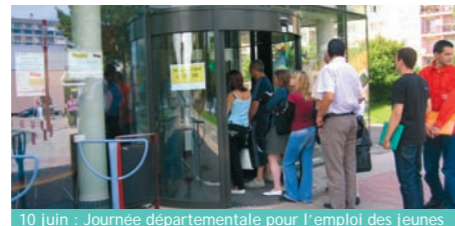
10 juin : Journée départementale pour l'emploi des jeunes