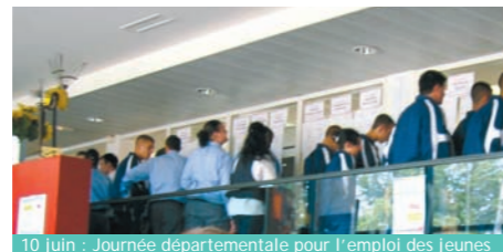
10 juin : Journée départementale pour l'emploi des jeunes